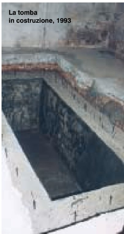
La tomba in costruzione, 1993

La tomba di fra Giacomo è come la casa d'un amico, che si frequenta per risollevarsi, o per decidersi.