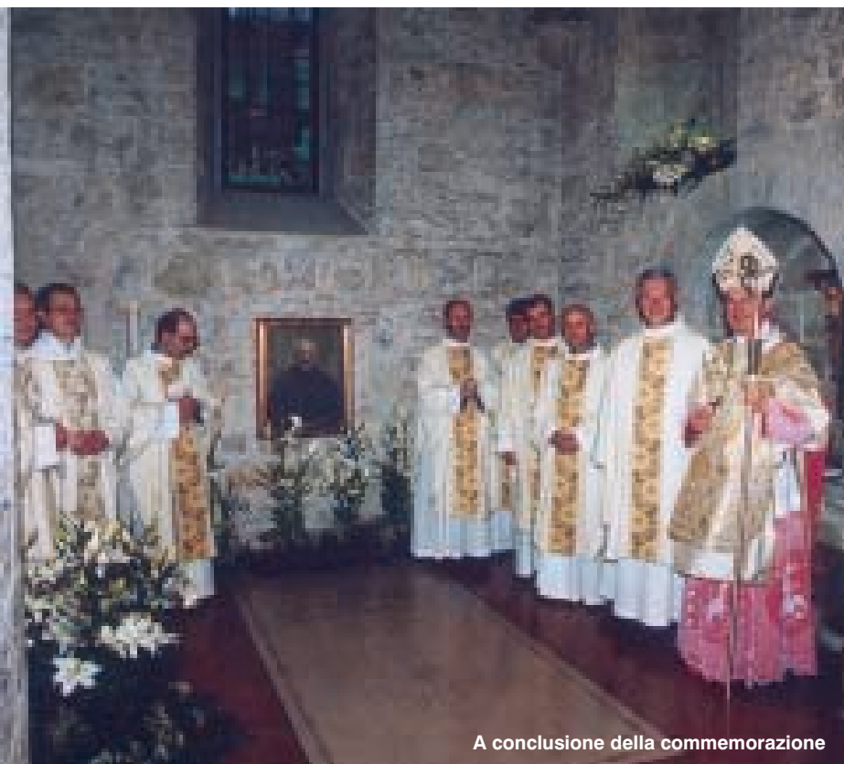
A conclusione della commemorazione

Ogni 27 del mese alle ore 18.30 nel nostro santuario viene celebrata una santa Messa secondo le intenzioni di quanti si raccomandano alla preghiera del Servo di Dio.