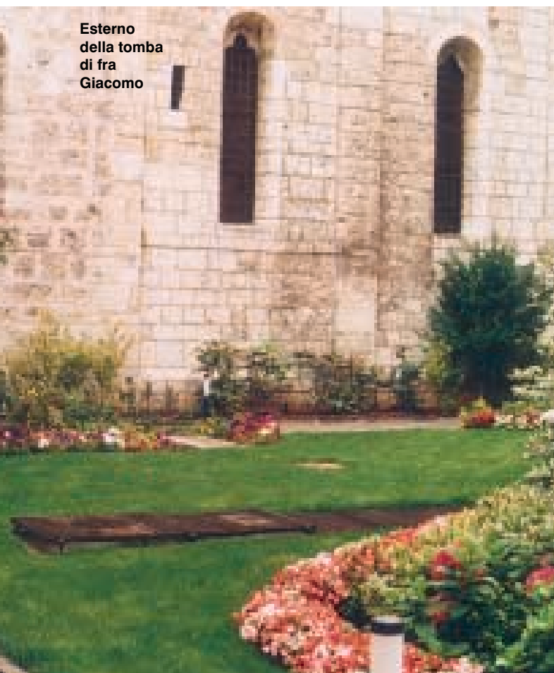
Esterno della tomba di fra Giacomo

Il Servo di Dio fra Giacomo Bulgaro morì la sera del 27 gennaio 1967 nel convento San Francesco di Brescia e fu sepolto nel cimitero cittadino.