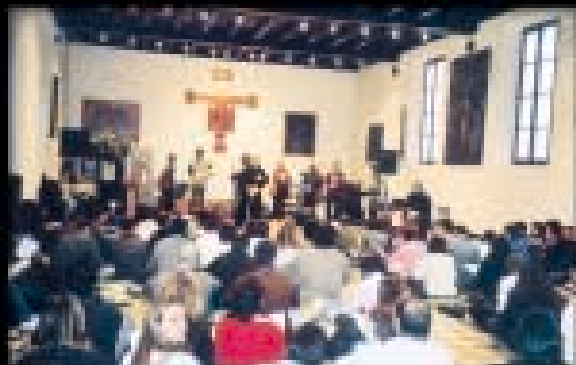
Convegno dei giovani