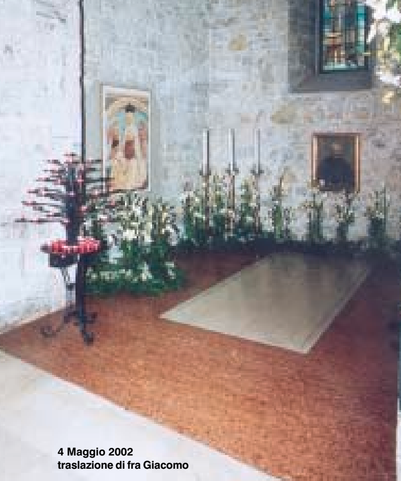
4 Maggio 2002 traslazione di fra Giacomo