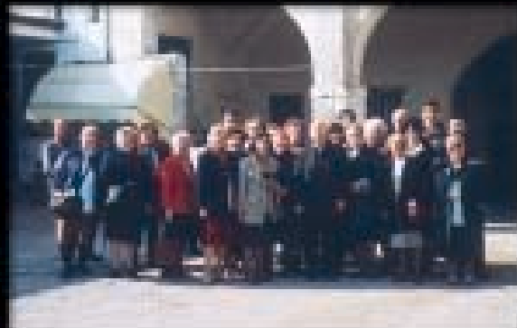
Alla casa natale del Servo di Dio