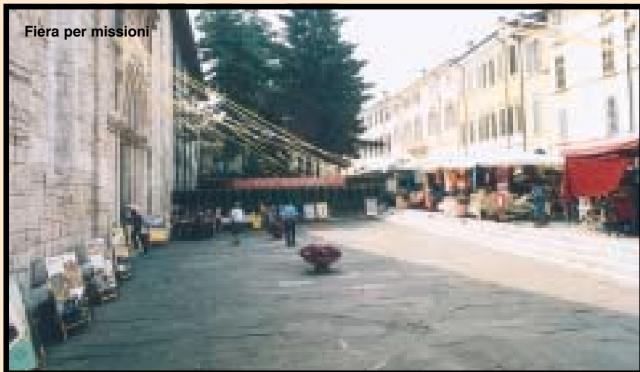
Fiera per missioni